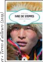
prix « Carnets voyageurs » et « Terre d'auteurs » (2019)